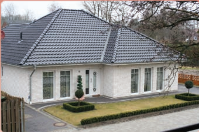
Das FRIDA -Haus in der Bödigestraße 6

„Da muß man doch was tun“, meinte unser Chef. Das war für uns gleichzeitig die Initialzündung und das Projekt „ FRIDA “ wurde erschaffen.